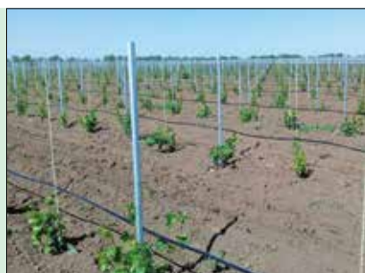
Мелиорация в приоритете