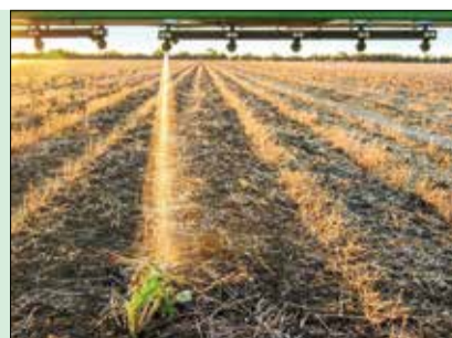
AmaSpot AMAZONE: на прицеле каждый сорняк!