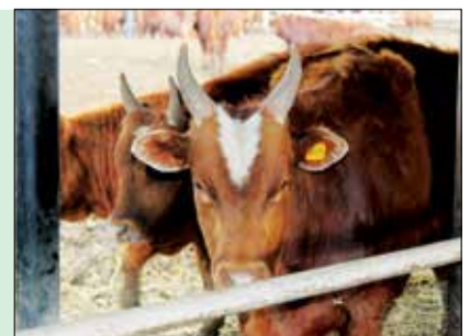
Калмыцкий скот: животные с характером