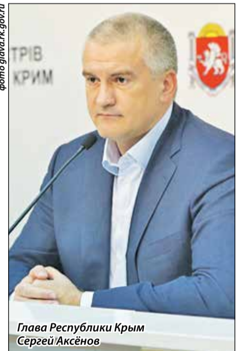
Глава Республики Крым Сергей Аксёнов