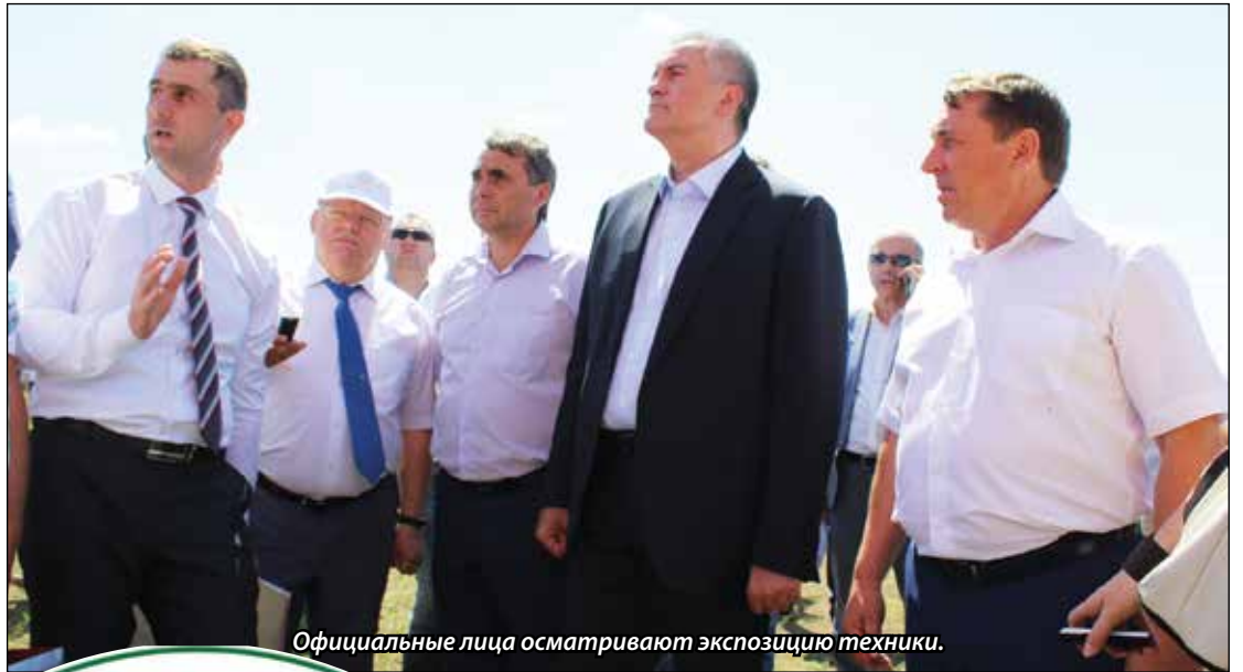
Официальные лица осматривают экспозицию техники.

Инновационная агротехнологическая Республиканская научно-практическая конференция «День поля – 2018» претендует на всероссийский уровень. Об этом, в частности, заявил один из почётных гостей мероприятия, которое состоялось в селе Клепинино Красногвардейского района, директор департамента растениеводства, механизации, химизации и защиты растений Министерства сельского хозяйства Российской Федерации Пётр Чекмарёв. Представитель Минсельхоза РФ подчеркнул, что уровень проведения «Дня поля-2018» увеличился в разы, по сравнению с 2016 годом, когда он посещал научно-практическую конференцию. Теперь Крым вполне может рассматриваться, как площадка для проведения Всероссийского Дня поля уже в 2019 или 2020 году.